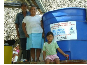
Sistema de agua segura en El Litoral, río Putumayo.