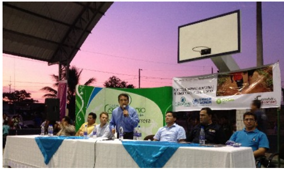
Inauguración de cancha polideportiva construida en conjunto por ACNUR y el Municipio en el barrio de San Valentin de Lago Agrio.