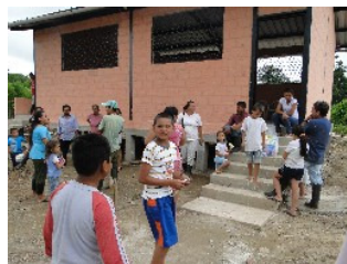
Escuela abierta en la comunidad de El Porvenir, río Putumayo