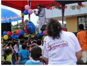
Día Mundial del Refugiado en Lago Agrio