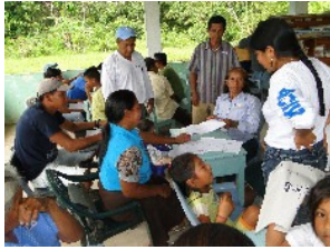
ACNUR acompaña a las comunidades con asesoría y capacitaciones