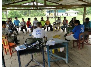
Diagnóstico participativo en una comunidad del río Putumayo