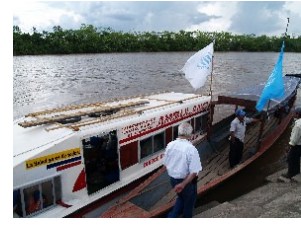
La barcaza médica fluvial permite ofrecer acceso al sistema público de salud en zonas muy remotas