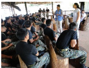
ACNUR realiza regularmente capacitaciones sobre refugio con instituciones públicas y privadas