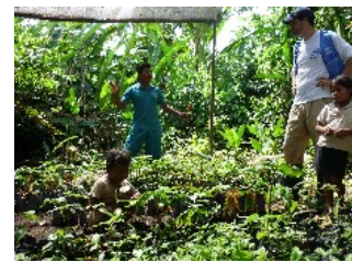
A través de capacitaciones agrícolas las comunidades de frontera están mejorando sus cultivos y la seguridad alimentaria.