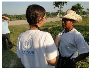
El Río habla , programa semanal en Radio Sucumbios, permite a la población de frontera explicar sus preocupaciones.