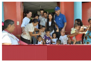
Centro Infantil de Buen Vivir inaugurado gracias a la coordinación con socios e instituciones del Estado.