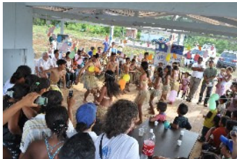
Inauguración de la casa de mujeres La Esperanza, en Barranca Bermeja, río San Miguel