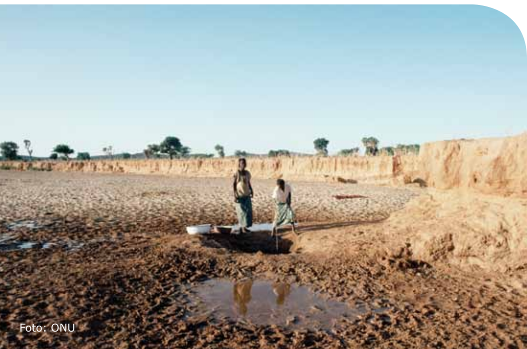
Leito seco de rio em Níger.

► Melhorar a maneira como conservamos e administramos nossos recursos hídricos , para promover o desenvolvimento e a proteção contra a desertificação.