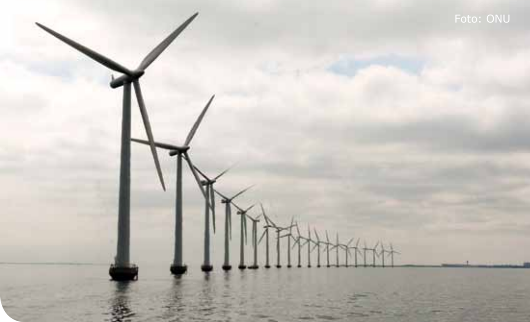
Parque eólico na costa de Middelgruden, na Dinamarca.