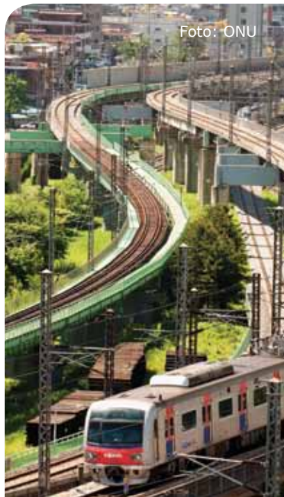
Um trem atravessa Seul, na República da Coreia.