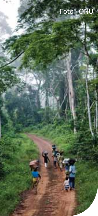
Florestas na Libéria.

“A agenda do desenvolvimento sustentável é a agenda do crescimento para o século 21.”