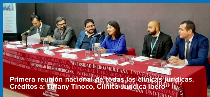
Primera reunión nacional de todas las clínicas jurídicas.

detenidas contradecían el plazo máximo constitucional para la privación de la libertad por razones administrativas.