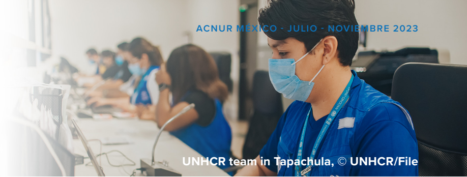
UNHCR team in Tapachula, © UNHCR/File