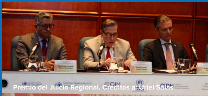
Premio del Juicio Regional.