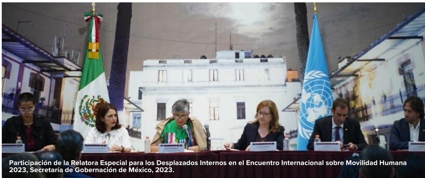
Participación de la Relatora Especial para los Desplazados Internos en el Encuentro Internacional sobre Movilidad Humana 2023, Secretaría de Gobernación de México, 2023.