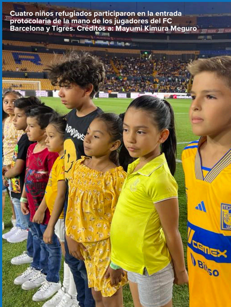
Cuatro niños refugiados participaron en la entrada protocolaria de la mano de los jugadores del FC Barcelona y Tigres.