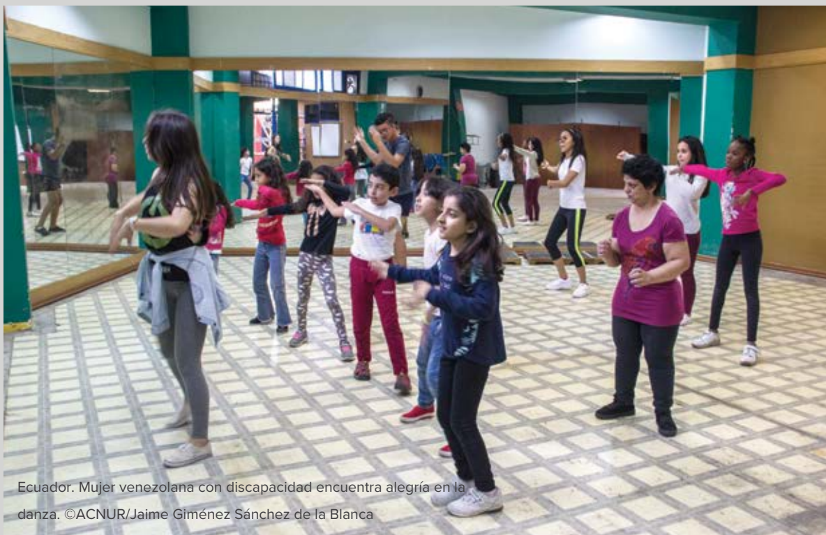
Ecuador. Mujer venezolana con discapacidad encuentra alegría en la danza.

Debido a las barreras físicas, comunicativas y actitudinales, las personas con discapacidad a menudo enfrentan obstáculos para recibir protección, asistencia y soluciones. Pueden sufrir discriminación tanto por su discapacidad como por su situación de desplazamiento; además, a menudo se les niega la oportunidad de participar en la toma de decisiones y de desempeñar funciones de liderazgo en sus comunidades.