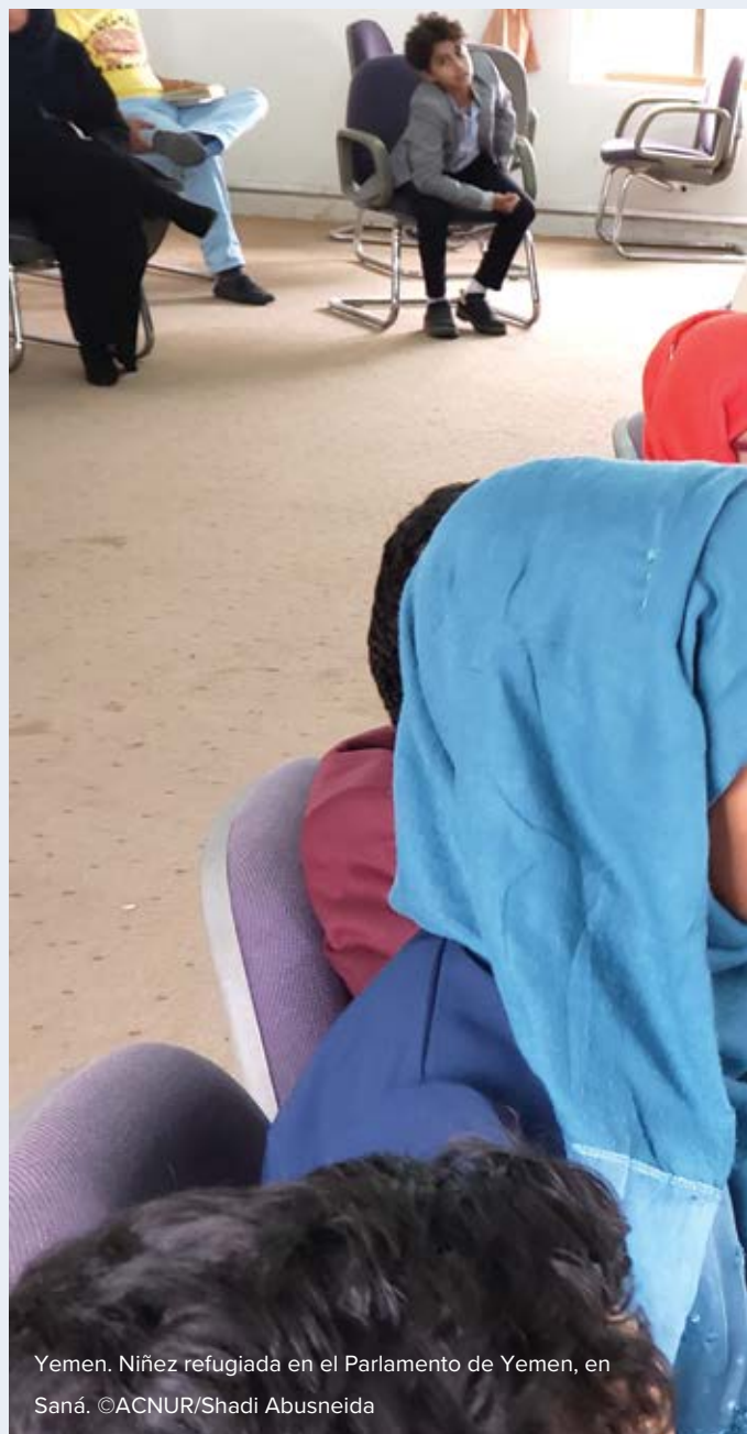
Yemen. Niñez refugiada en el Parlamento de Yemen, en Saná.

Aplicar un enfoque de EGD requiere considerar la intersección del género y la edad con otras características (por ejemplo, discapacidades, orientación sexual y/o identidad de género, religión, origen étnico, nivel de ingresos, educación), así como la manera en que tales intersecciones pueden conducir a riesgos de protección más complejos.