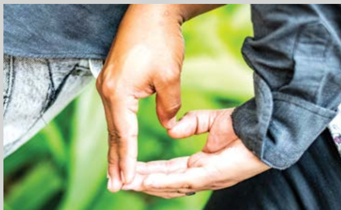
Guatemala. Pareja transgénero que desea gozar del derecho a ser “quienes somos, libres y sin miedo”.

Las normas culturales y sociales, junto con la legislación nacional discriminatoria y homofóbica, y la falta de conciencia y capacidad de respuesta dentro de las organizaciones humanitarias, a menudo obstaculizan la capacidad de las personas LGBTIQ+ de expresar sus necesidades, denunciar abusos y buscar servicios diseñados para apoyarlas.