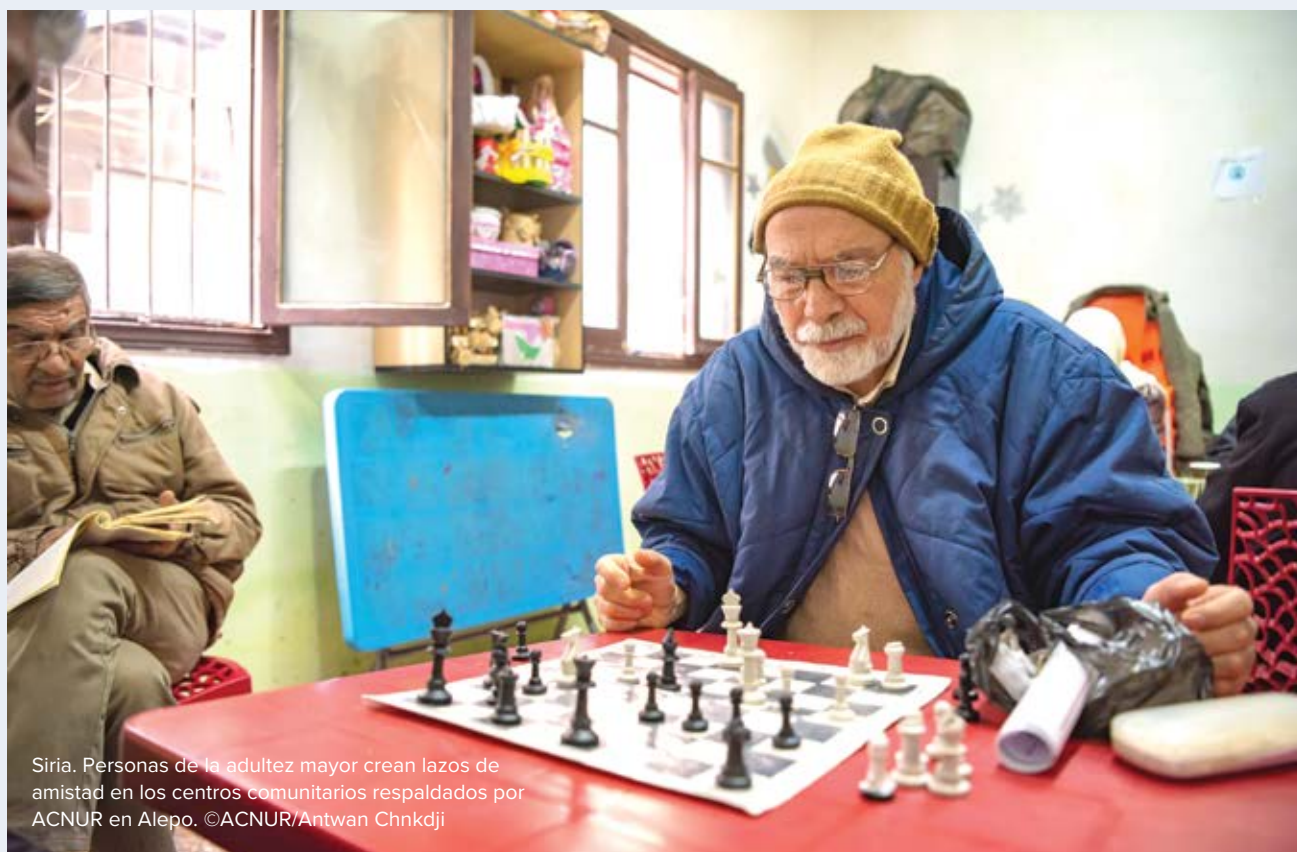
Siria. Personas de la adultez mayor crean lazos de amistad en los centros comunitarios respaldados por ACNUR en Alepo.