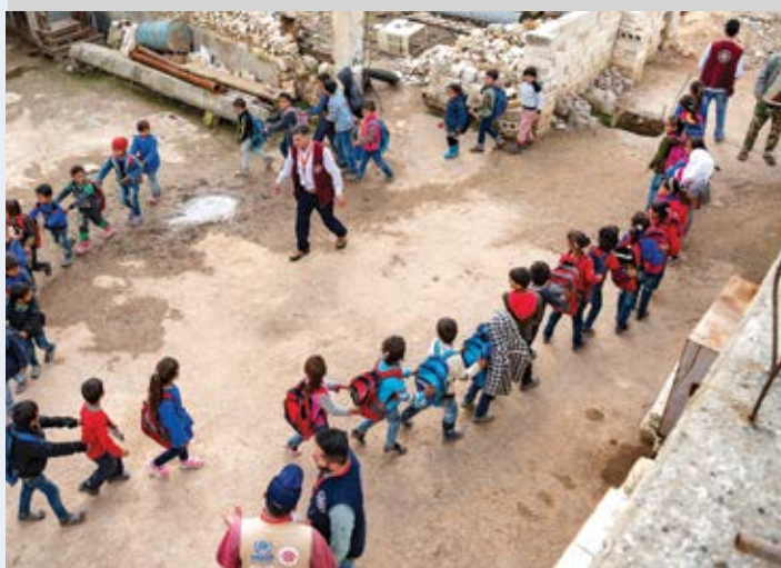
Siria. Equipos móviles enseñan a madre, padres, niñas y niños los peligros de las municiones sin detonar.

En Venezuela , ACNUR inició ejercicios de elaboración de perfiles y registro que establecen que los datos recopilados por la Agencia de la ONU para los Refugiados deben desagregarse por edad, sexo y diversidad, según sea posible y apropiado al contexto, con fines de análisis y programación.