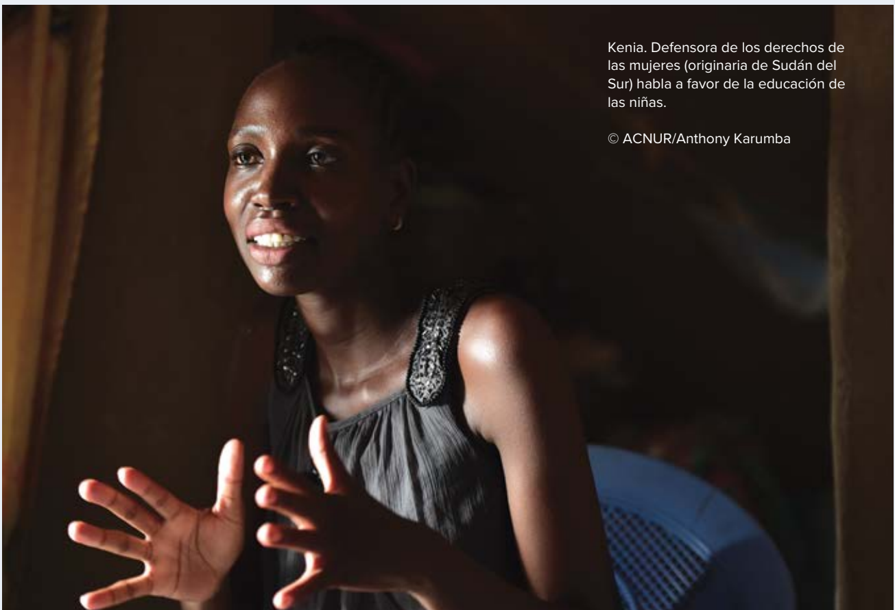
Kenia. Defensora de los derechos de las mujeres (originaria de Sudán del Sur) habla a favor de la educación de las niñas.

En Jordania, ACNUR apoya a las mujeres de interés a través de Social Enterprise (SEP, por sus siglas en inglés), que tiene como objetivo construir una marca que cambie las vidas y las percepciones de las personas refugiadas en todo el mundo. El proyecto SEP se convirtió en socio de Made 51, lo cual facilitó el lanzamiento y la gestión de una plataforma de mercado global para productos artesanales hechos por personas refugiadas. La alianza entre una organización no gubernamental (ONG) de Jordania, Jordan River Foundation (JRF, por sus siglas en inglés) e IKEA, una corporación multinacional, se basa en soluciones comerciales que ayudan a abordar los desafíos humanitarios y de desarrollo en Jordania, al tiempo que se crean empleos y se ofrecen oportunidades de crecimiento económico. Gracias a este proyecto, 75 mujeres sirias refugiadas obtuvieron empleo.