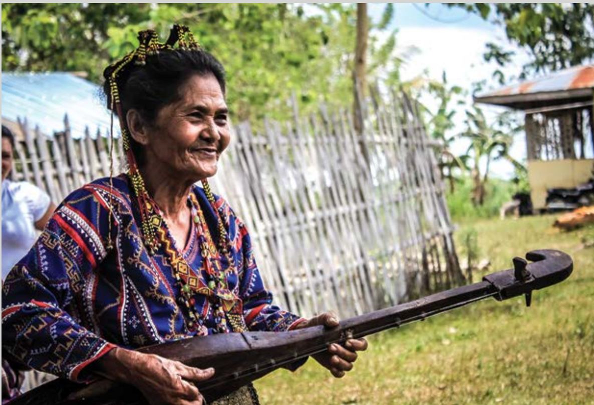
Filipinas. Mujer indígena da la bienvenida al equipo de ACNUR con música.