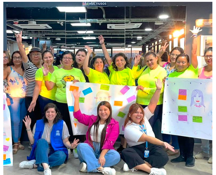
Mujeres de diferentes comunidades en Mejicanos participaron en las actividades organizadas por ACNUR para conmemorar el Día Internacional de la Mujer.