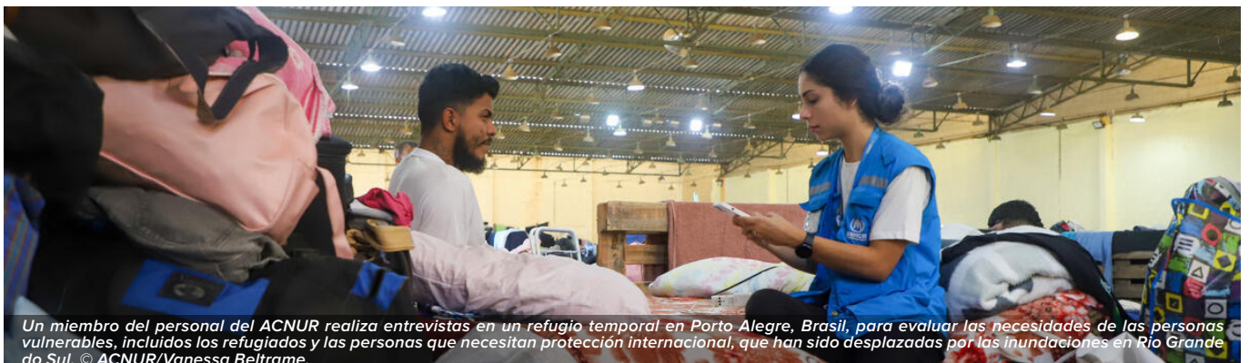
Un miembro del personal del ACNUR realiza entrevistas en un refugio temporal en Porto Alegre, Brasil, para evaluar las necesidades de las personas vulnerables, incluidos los refugiados y las personas que necesitan protección internacional, que han sido desplazadas por las inundaciones en Río Grande do Sul.

https://www.unhcr.org/innovation/environment-and-climate-action-innovation/