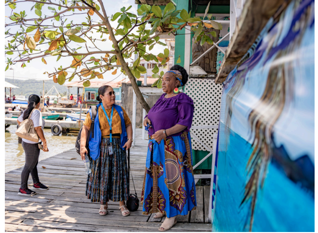
ACNUR apoyó la creación de la Red de Agentas de Protección Comunitaria.