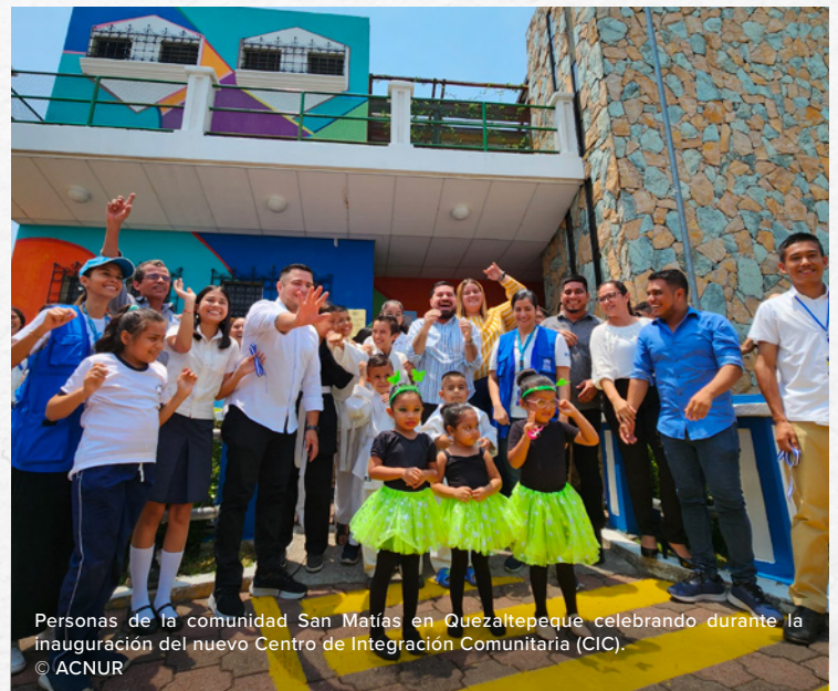
Personas de la comunidad San Matías en Quezaltepeque celebrando durante la inauguración del nuevo Centro de Integración Comunitaria (CIC).