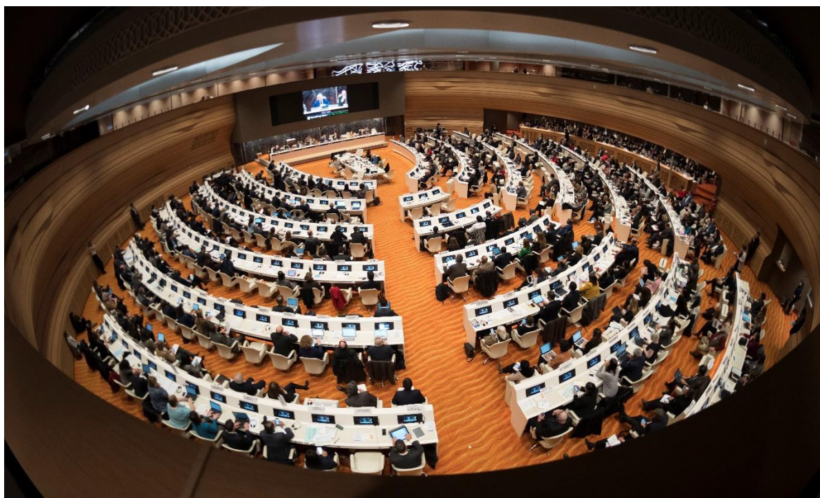
El Diálogo del Alto Comisionado sobre los Desafíos de la Protección en diciembre de 2017 sirvió para hacer un balance sobre los avances realizados en el desarrollo del Pacto Mundial sobre Refugiados, antes de la publicación del "borrador cero" en enero de 2018.