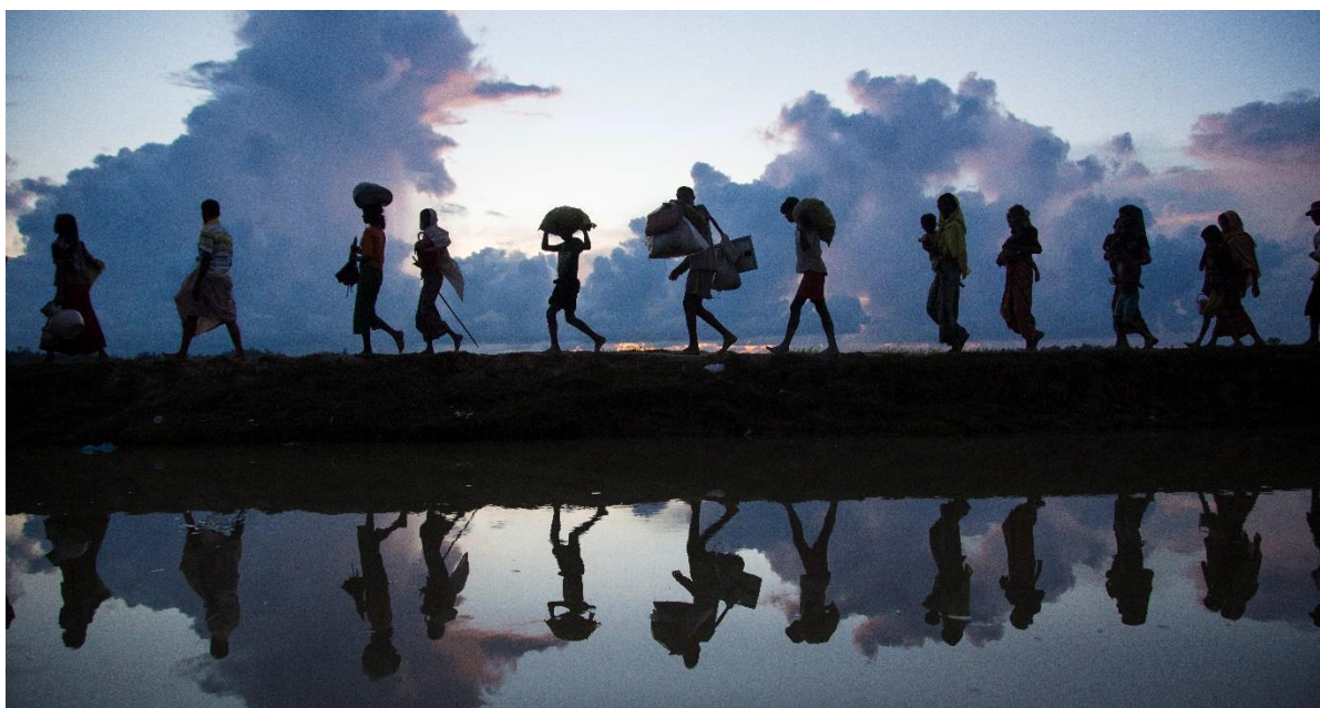
Refugiados Rohingya ingresan a Bangladesh en octubre 2017.