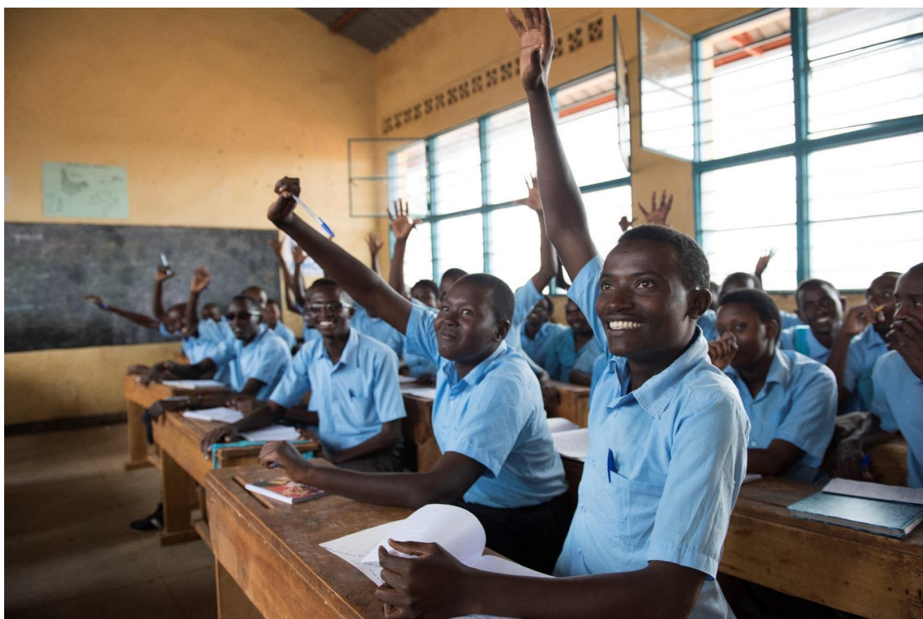
Refugiados de Burundi y miembros de la comunidad local de acogida de Ruanda estudian uno al lado del otro en la escuela Paysannat en el este de Ruanda.