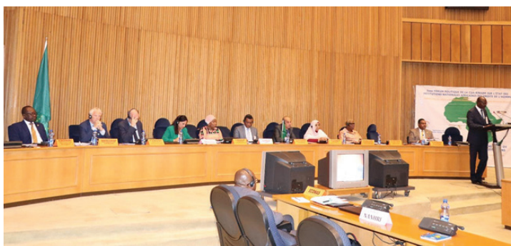
Sesión de apertura del Foro de políticas AUC-RINADH sobre el estado de las instituciones africanas de derechos humanos, 5 de septiembre de 2019.

Como parte de esta cooperación, las dos instituciones trabajaron con el ACNUDH y el PNUD en la organización del tercer Foro de políticas sobre el estado de los derechos humanos en África en 2019, que se centró en soluciones duraderas al desplazamiento forzado. Algo en consonancia con el lema de la Unión Africana (UA) en 2019: “Refugiados, Retornados y Desplazados internos: Hacia soluciones duraderas al desplazamiento forzado en África”. En este foro, las partes interesadas desarrollaron y adoptaron un plan de acción continental sobre la contribución de las INDH a las soluciones duraderas sobre los desplazamientos forzados en África, con un fuerte enfoque en la promoción de la Convención de Kampala. 69