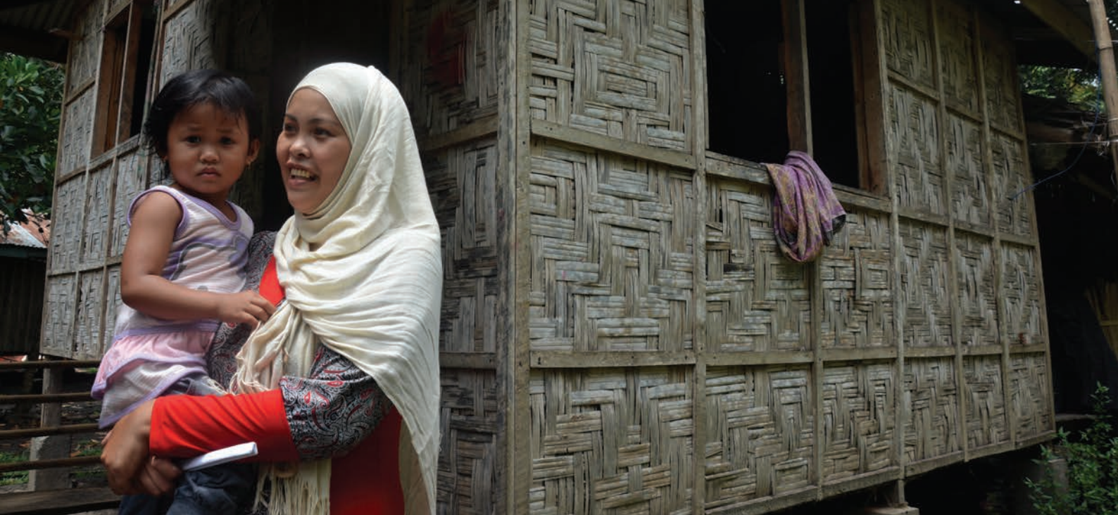
Una mujer desplazada con su hija en Madiya, Filipinas (2017).