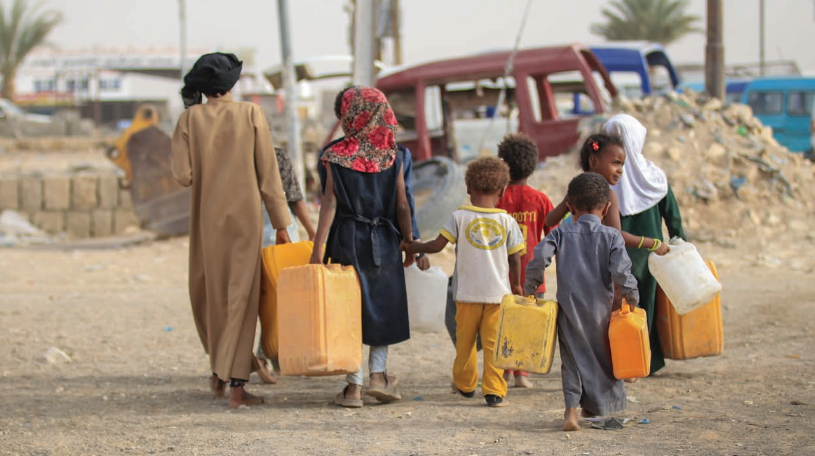
Niños desplazados van a por agua al punto de distribución del campamento de Al-Rawdah en Marib, el Yemen (2021).