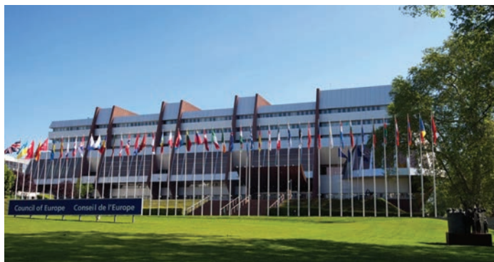
Palacio de l'Europa.

Además, al tiempo que respalda los Principios rectores, el Comité de Ministros del Consejo de Europa ha reconocido que las personas desplazadas internas “tienen necesidades específicas en virtud de su desplazamiento” y ha desarrollado un conjunto de 13 principios para guiar a los Estados miembros “al formular su legislación y práctica internas” para garantizar que abordan eficazmente los desplazamientos internos. 94 De manera similar, en una recomendación reciente, aunque no específicamente centrada en las personas desplazadas internas, el Comité de Ministros hizo hincapié en el “gran potencial e impacto de las INDH independientes para la promoción y protección de los derechos humanos en Europa” y formuló una serie de recomendaciones instando a la creación y el fortalecimiento de las INDH y también a la instauración y el desarrollo de un entorno seguro y propicio así como a la promoción de la cooperación y el apoyo a las INDH. 95 En la misma línea, la Asamblea Parlamentaria del Consejo de Europa (APCE) ha adoptado varias recomendaciones y resoluciones que hacen hincapié, entre otras cosas, en la necesidad de “asistencia internacional continua a las personas desplazadas internas” y en la importante función que pueden desempeñar las INDH en el seguimiento y la protección de los derechos de las personas desplazadas internas. 96