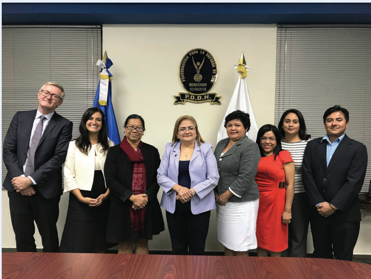
Encuentro entre la Relatora Especial y la Defensora del Pueblo de El Salvador durante su misión oficial al país en 2017

Las violaciones de los derechos humanos son tanto una causa como una consecuencia de los desplazamientos internos, y el riesgo de que se vulneren aumenta durante los desplazamientos. Periódicamente, tanto en eventos como durante sus visitas a los países, la Relatora Especial se reúne con las INDH en que le transmiten documentos e información para sus comunicaciones a los Estados sobre violaciones de los derechos humanos de las personas desplazadas internas. La Relatora Especial ha participado en numerosas reuniones y eventos para hablar y promover la función de las INDH en relación con el desplazamiento interno. También reflexiona sobre los análisis y problemas de las INDH en su país y los informes temáticos, prestando especial atención a la protección y la vigilancia, las leyes y políticas y la promoción de la participación de las personas desplazadas internas. Puede contactar con la Relatora Especial en mdp@ohchr.org .