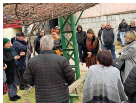
Reunión del Defensor público con personas desplazadas internas que viven en Poti en febrero de 2020.

Por ejemplo en Georgia , en 2013, la Defensoría del Pueblo y varias organizaciones de la sociedad civil y organizaciones internacionales llevaron a cabo una labor de vigilancia conjunta para evaluar el cumplimiento de los derechos humanos de un nuevo proceso de registro a nivel nacional para las personas desplazadas internas impulsado por el Estado. Esta vigilancia permitió a la INDH recopilar información detallada sobre la situación de las personas desplazadas internas, identificar deficiencias en la legislación y la práctica, y asesorar a los órganos estatales sobre las acciones necesarias. La Defensoría del Pueblo también ha desarrollado sólidos sistemas de vigilancia de la situación de las viviendas de las personas desplazadas internas, proporcionando recomendaciones periódicas a través de informes anuales y especiales a los organismos estatales sobre alojamientos peligrosos y asesorando a los responsables de la toma de decisiones sobre la reubicación de las personas desplazadas internas como parte del programa de soluciones de vivienda duradera. 47