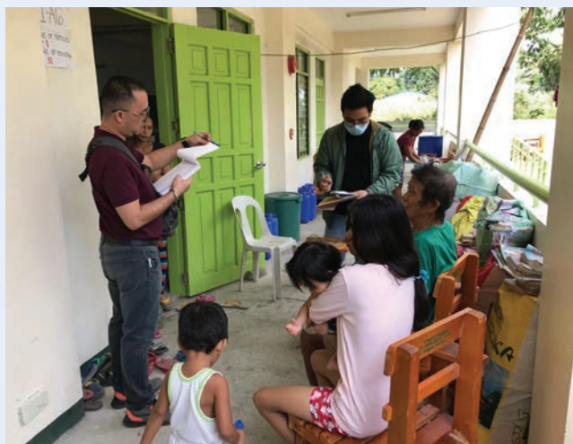
Entrevistas con familias de personas desplazadas internas afectadas por la erupción del volcán Taal en un sitio de evacuación en Balayan, Batangas, febrero de 2020

Las Filipinas es un país afectado por desplazamientos internos recurrentes provocados por una variedad de causas como desastres resultantes de peligros naturales, conflictos y desarrollo a gran escala. En este contexto, la Comisión de Derechos humanos de las Filipinas, que tiene un amplio mandato para la protección y promoción de los derechos humanos, 49 ha trabajado en estrecha colaboración con el ACNUR para abordar los desplazamientos internos, concretamente a través del establecimiento de un proyecto conjunto sobre personas desplazadas internas. Uno de los resultados concretos de dicho proyecto fue el desarrollo de una herramienta de vigilancia del desplazamiento , así como una Guía del usuario 50 y una Guía de entrevistas para ayudar al personal sobre el terreno en la recopilación y análisis de datos. La herramienta está destinada al personal de la Comisión y a los asociados que participan en las misiones de vigilancia para determinar las condiciones de las personas desplazadas internas sobre el terreno.